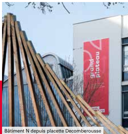
Bâtiment N depuis placette Decomberousse