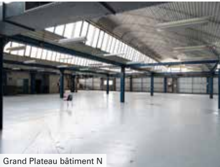
Grand Plateau bâtiment N