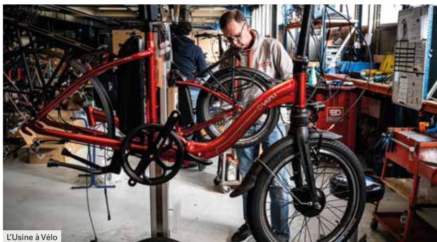
L'Usine à Vélo

Depuis juin 2022, l'Étape 22D accueille « Grand Plateau », un tiers-lieu au service des acteurs de la mobilité active . Sur 3 600 m 2 , le bâtiment N héberge des artisans, des entrepreneurs et des associations dans le domaine du cycle et de la mobilité de demain. Une vingtaine de structures locataires et plus de 70 personnes sont déjà présentes, parmi lesquelles « l'Usine à Vélo », coopérative spécialisée dans l'assemblage de vélos.