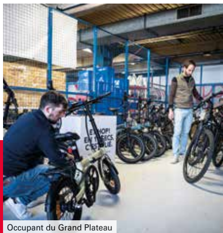
Occupant du Grand Plateau