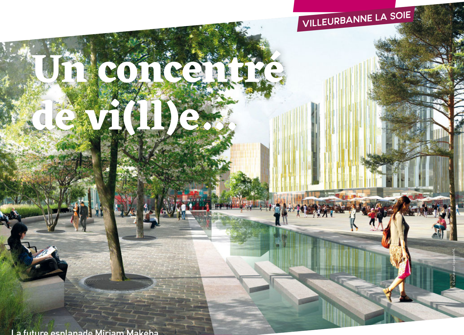
La future esplanade Miriam Makeba

Découvrez dans cette lettre le visage du nouveau quartier Villeurbanne La Soie.