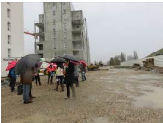
Sur l'emprise de la future promenade jardin

Malgré un temps peu engageant, plusieurs habitants ont participé à la visite sur site pour mieux comprendre l'emprise des futures espaces publics